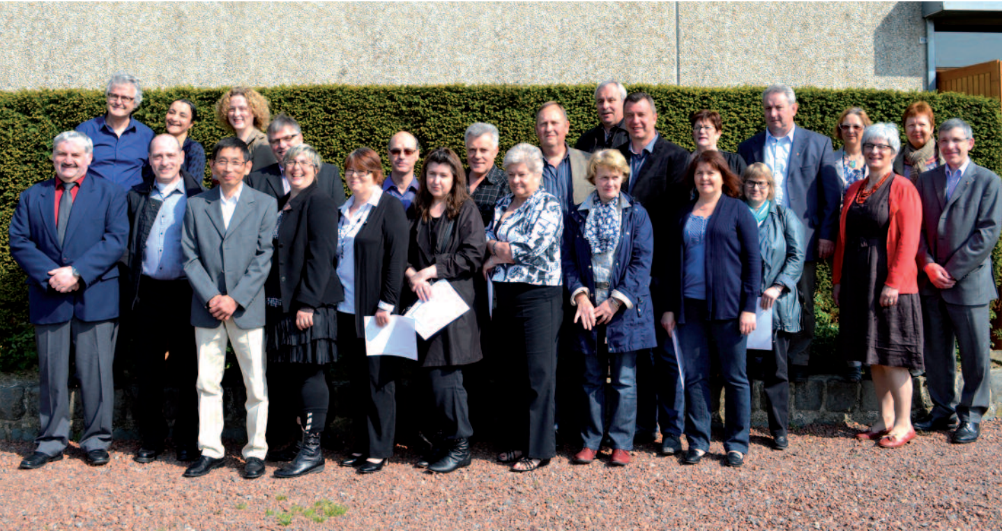
Réception traditionnelle pour les médaillés du travail : 5 argent - 9 vermeil - 6 or - 7 grand or.