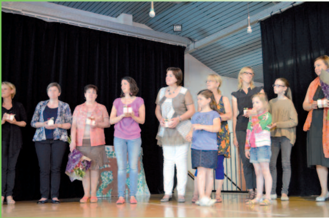
L'équipe pédagogique maternelle.