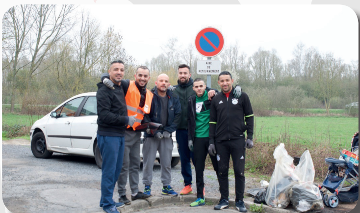
L' Association LA LUMIÈRE