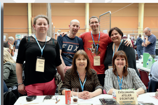
Atelier d'écriture d'évolumaing