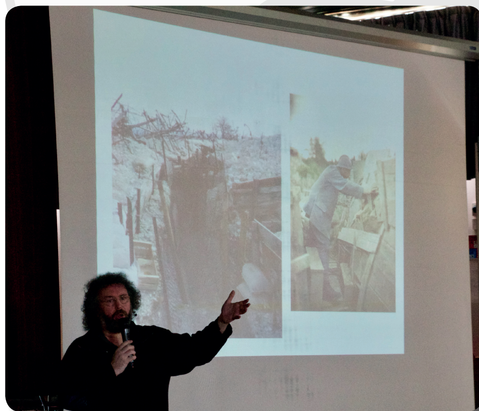
Olier : la conception d'une Bande Dessinée