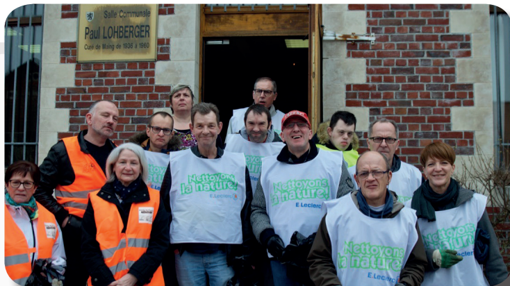
L' Association PERCE NEIGE