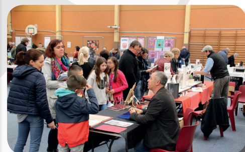
Rencontres avec les auteurs