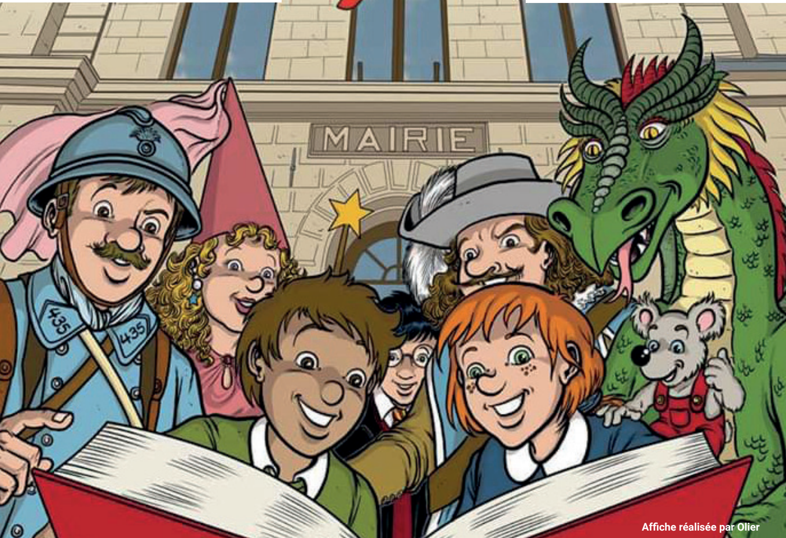
Affiche réalisée par Olier