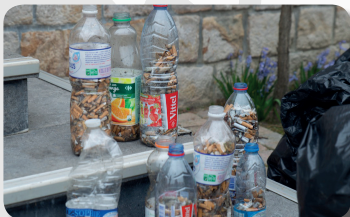
Fumeurs : ne jetez plus vos mégots dans la nature !