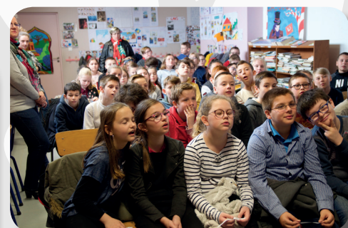
Intervention dans les écoles