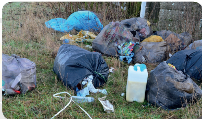
Quelques déchets trouvés dans la nature