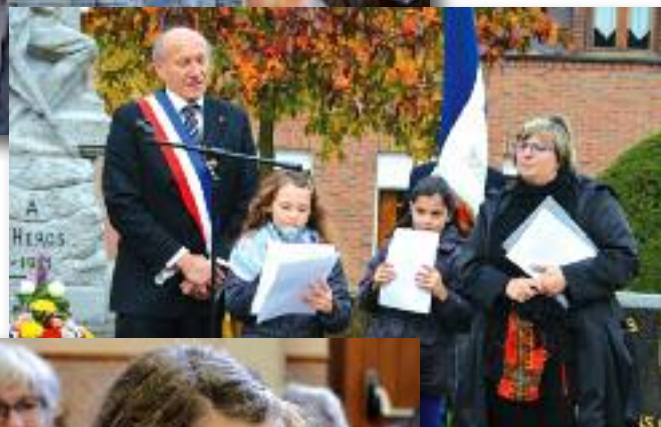
Discours au monument au morts