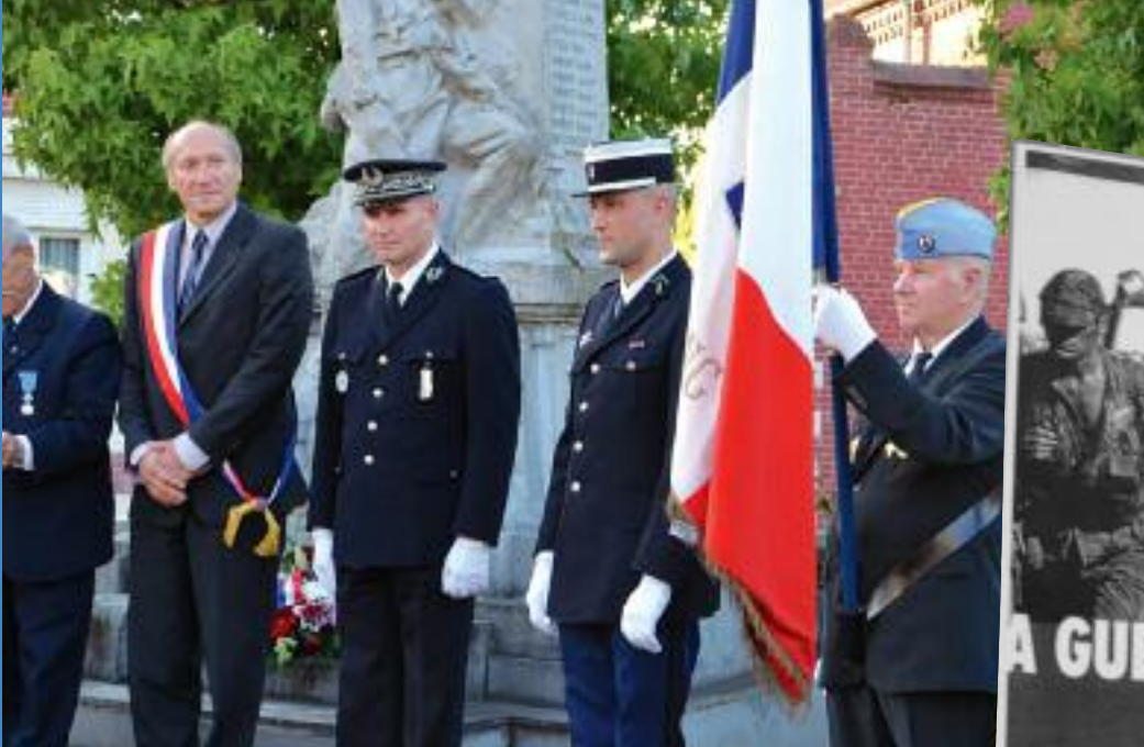
Extrait d'un témoignage paru dans l'ouvrage «Il était une fois des Harkis»