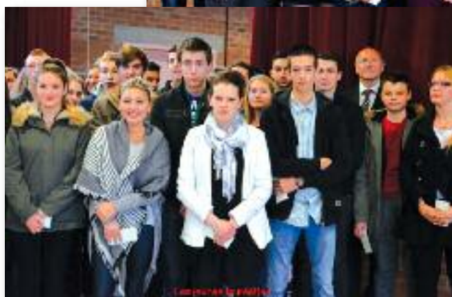
Lauréats de juin 2015 : BEPC, BEP, CAP et BAC