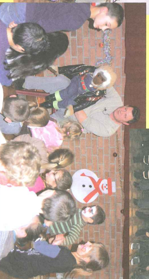
Saint-Nicolas des nourrissons.