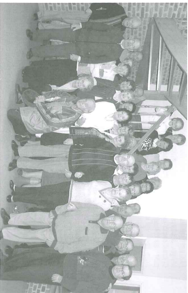
Vive le roi, vive la reine. Vive l'amitié maingeoise. A.M.G.

Une nouvelle preuve encore, du dynamisme et solidarité de notre tissu associatif maingeois qui à travers la générosité de ses membres, luttent contre la solitude, le désarroi que peuvent éprouver bon nombre de personnes.