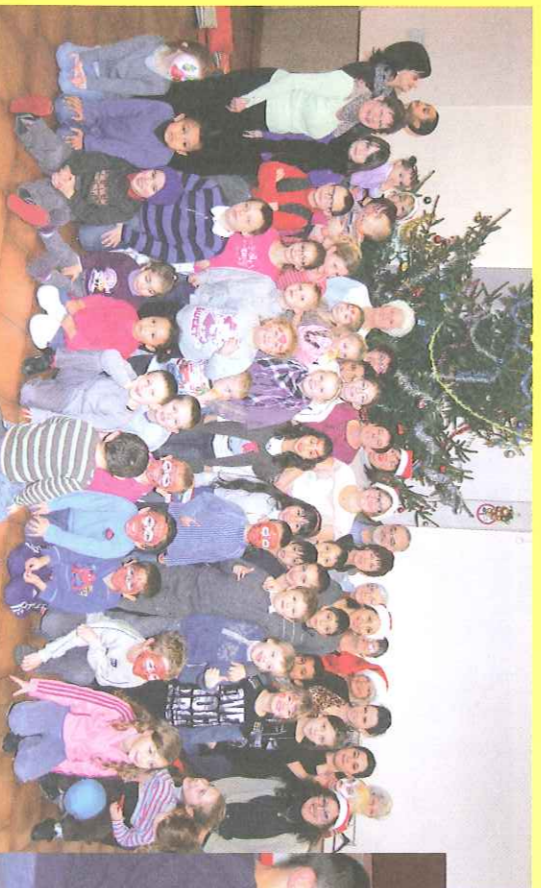
Noël Epicerie Sociale.