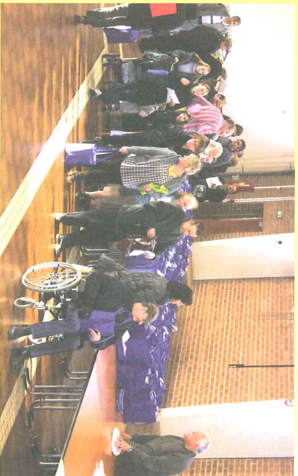
Coils des aînés.