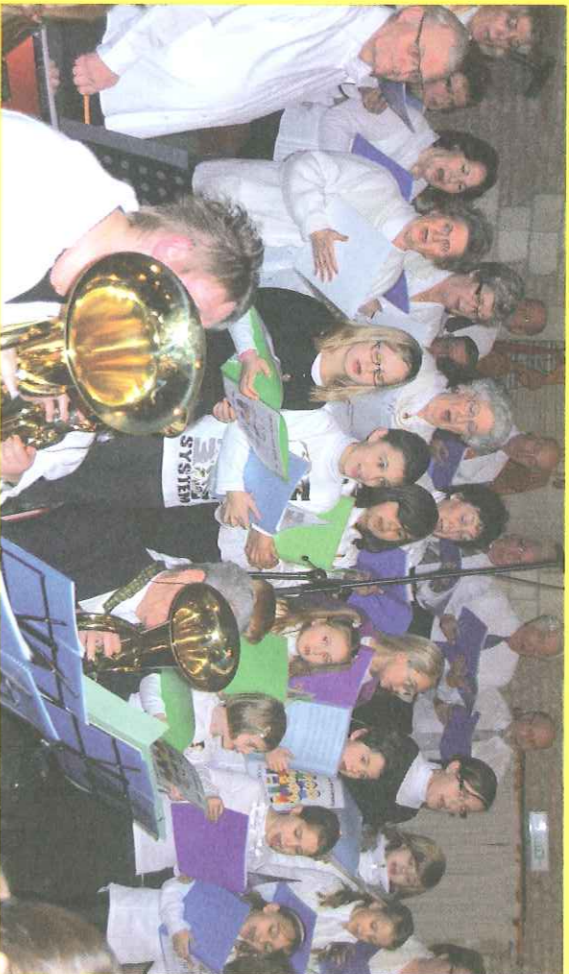
Concert de Noël.