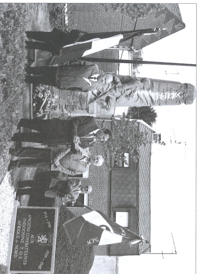
Maingeoises, Maingeois !

"La prise de la Bastille, le 14 juillet 1789, marque la prise du pouvoir par le peuple français, la fin de la monarchie absolue et le début de la République.