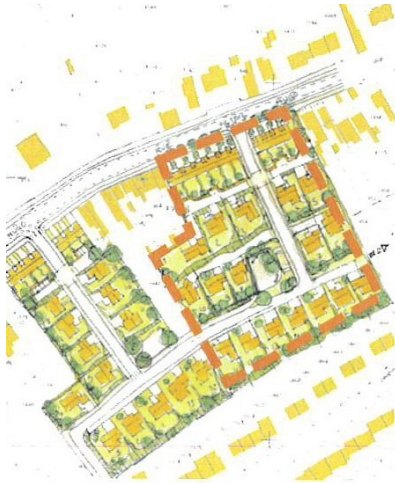
ESQUISSE de mai 2018 :