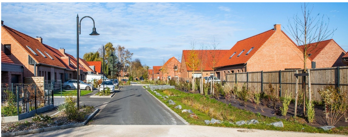
Exemple d'une voirie principale bordée d'espaces verts généreux à Péronne-en-Mélantois