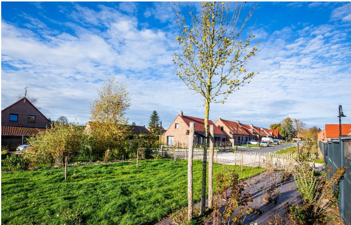
Exemple d'un espace commun de détente à Péronne-en-Mélantois

Un espace commun de détente s'inscrit au centre du projet d'ensemble au niveau de la connexion entre la partie Est et Ouest. Des plantations arborées constituées d'arbrisseaux à fleurs marqueront les saisons par leurs floraisons ou leurs feuillages colorés en automne, ils apporteront un voile ombragé en été. Les petits fruits et baies des pommiers à fleurs et des amélanchiers viendront de plus régaler les oiseaux. Des haies vives arbustives participeront à la gestion des limites avec les lots privés. Quelques bancs seront mis en place pour profiter de cette ambiance calme et sereine.